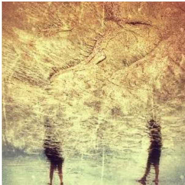
PhotoMind: Pierre Emanuel

Diepweg in zichzelf beweegt zij een paar vingers en lijkt daarbij te knikken; een lieve groet? – of slechts wat ik er nu in wil zien: een teken uit haar wereld.